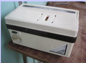
黒板消しクリーナー7台