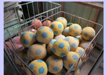
サッカーボール40個