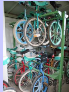
ノンパンク輪車6台