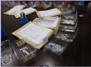
ベルマークを番号別に トレイに分ける。