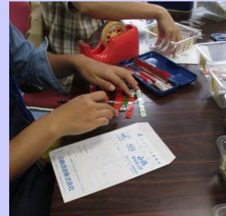
点数を集計して、 袋に入れる。