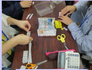
10枚ずつ テープで貼る。