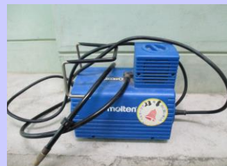
ミニコンプレッサー