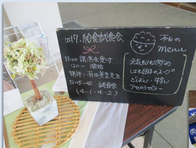
かわいい飾りで、お出迎えをしてくれました。