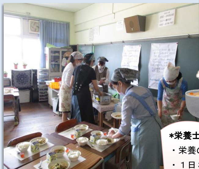
学年委員さんが準備をしてくれました。