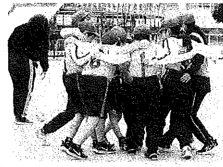
4年 学年イベント・球技大会