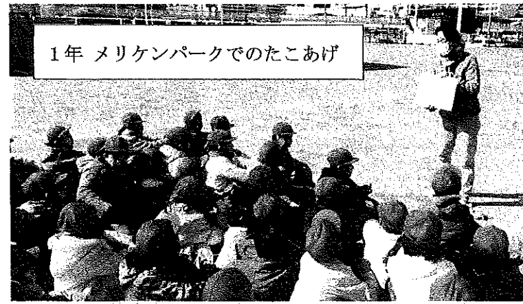
1年 メリケンパークでのたこあげ