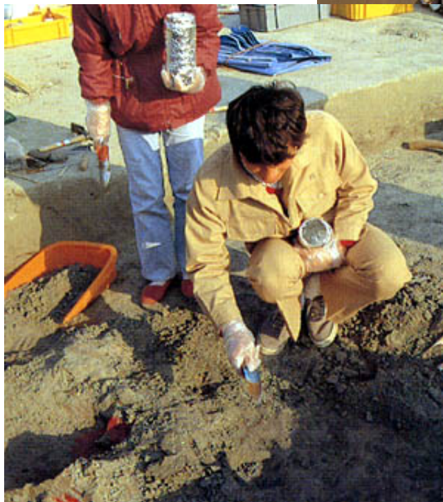
骨の含まれた地層中から脂肪酸を 検出するためのサンプリング作業