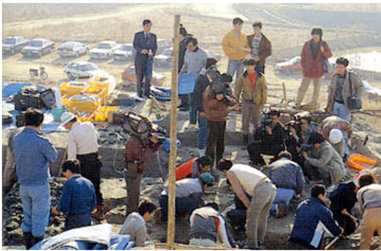
報道陣でにぎわう発掘現場