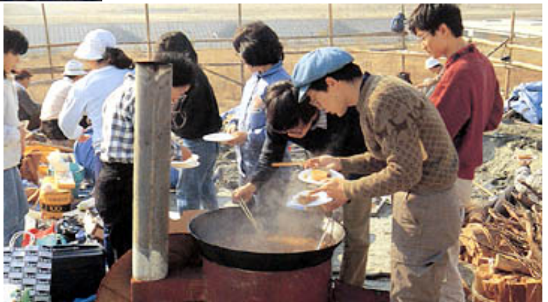
昼食のオデンはおいしかった