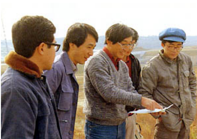
今までに出た骨について議論する