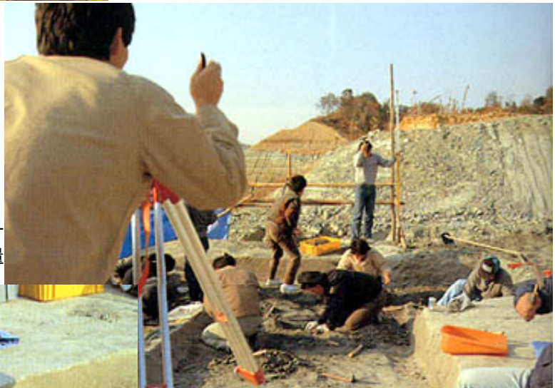
正確な記録を残す ための測量