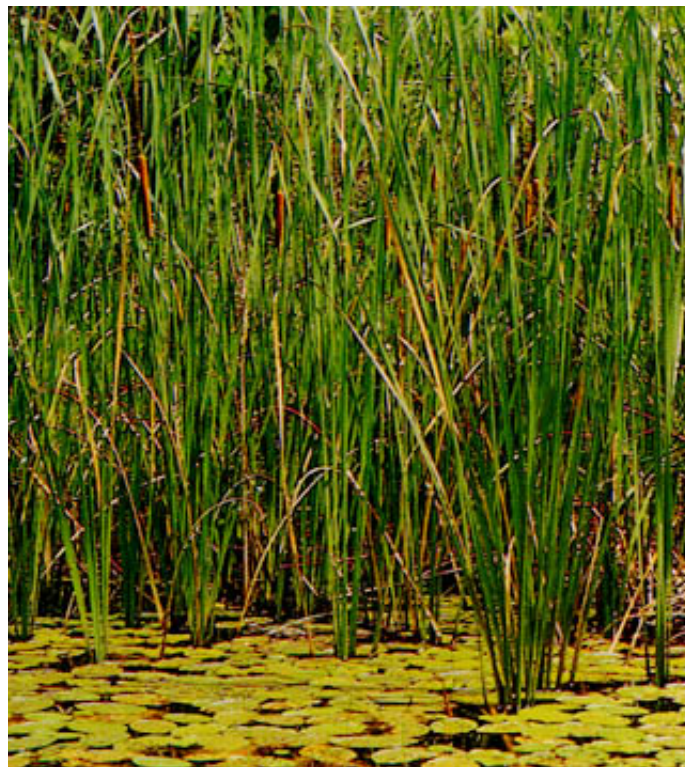
ヒメガマ 稲美町 1984.8.