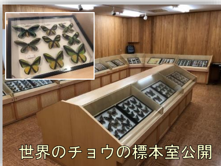
世界のチョウの標本室公開