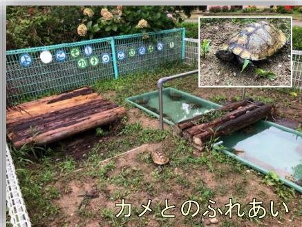
カメとのふれあい