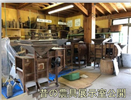
昔の農具展示室公開