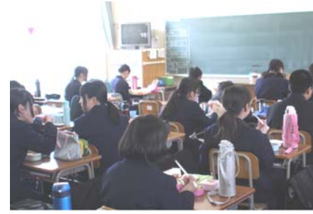
昼食時の様子(本庄中)

教育委員会では、平成24年2月より有識者や保護者等で構成する「市立中学校の昼食のあり方検討会」を6回にわたり開催し、また市会においても積極的な議論をいただくなど、望ましい昼食のあり方の検討を重ねてきました。その結果以下の方針で給食の開始が決定しました。