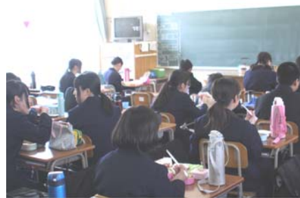
昼食時の様子(本庄中)

教育委員会では、平成24年2月より有識者や保護者等で構成する「市立中学校の昼食のあり方検討会」を6回にわたり開催し、また市会においても積極的な議論をいただくなど、望ましい昼食のあり方の検討を重ねてきました。その結果以下の方針で給食の開始が決定しました。