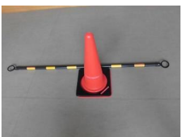
トラバー10本コーン・コーン用ベルト10個